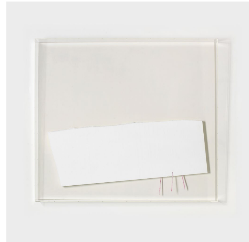
O.T., 2018 styrofoam, glass behind acrylic glass cover polystyrene, verre, boîte en acrylique 161,5 × 181,5 × 20 cm

ou sous les surfaces blanches une ombre autonome qui semble y être peinte. À l'aide de ces matériaux concrets et tactiles que sont le verre et le polystyrène, Heinzmann se tourne ici vers l'un des plus vieux rêves de la peinture : peindre avec la lumière autant qu'avec la matière. La présence tridimensionnelle de chacune de ces peintures est accentuée par des encadrements asymétriques qui biaisent subtilement l'angle de vue et le multiplient. Le groupement des boîtes en acrylique conçues pour ces oeuvres mènent le regard autour de la pièce en un cercle ouvert et ondulant.