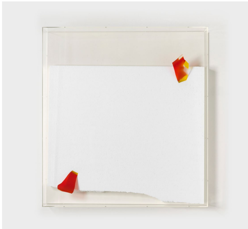
O.T., 2018 styrofoam, glass behind acrylic glass cover polystyrene, verre, boîte en acrylique 113,5 × 104,5 × 19 cm

Ces vingt dernières années, Thilo Heinzmann (né 1969) a développé un langage visuel raffiné pour explorer les possibilités esthétiques et synesthésiques de la peinture. En enquêtant sur les bases multiples de ce médium — composition, surface, forme, couleur, lumière, texture, échelle —, son œuvre suscite des sensations nouvelles et de nouvelles manières de voir. Depuis les années 1990, les œuvres d'Heinzmann incluent du polystyrène, une substance lisse et utilitaire mais dotée pour autant d'une structure interne chaotique. Cette dichotomie matérielle s'intensifie dans les nouvelles œuvres peintes d'Heinzmann :