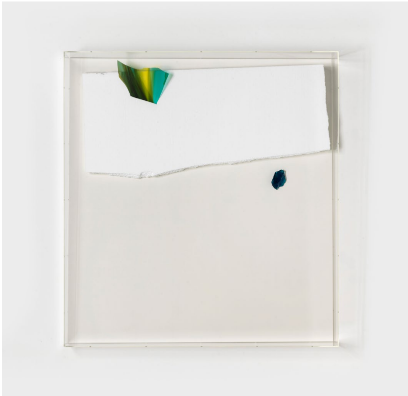
O.T., 2018 styrofoam, glass behind acrylic glass cover polystyrene, verre, boîte en acrylique 145,5 x 135,5 x 22 cm

umění – The Brno House of Arts, Brno (2006); 36 x 27 x 10, Volkspalast, Berlin (2005); deutschemalereizweitausenddrei , Frankfurter Kunstverein, Frankfurt am Main (2003); Viva November , Städtische Galerie Wolfsburg, Wolfsburg (2001); Malerei , INIT Kunsthalle, Berlin (1999); Offencia Europa , Galleria d'Arte Moderna di Bologna, Bologna (1999) and Junge Szene , Secession, Vienna (1998).