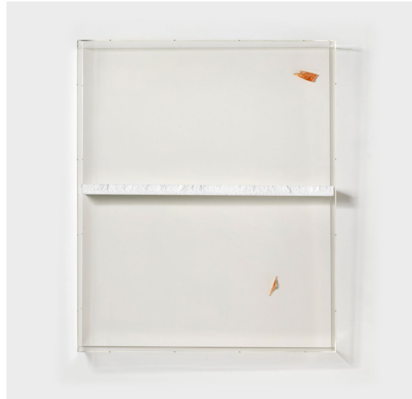
O.T., 2018 styrofoam, glass behind acrylic glass cover polystyrene, verre, boîte en acrylique 125,5 x 104,5 x 19 cm

umění – The Brno House of Arts, Brno (2006); 36 x 27 x 10, Volkspalast, Berlin (2005); deutschemalereizweitausenddrei , Frankfurter Kunstverein, Frankfurt am Main (2003); Viva November , Städtische Galerie Wolfsburg, Wolfsburg (2001); Malerei , INIT Kunsthalle, Berlin (1999); Offencia Europa , Galleria d'Arte Moderna di Bologna, Bologna (1999) and Junge Szene , Secession, Vienna (1998).